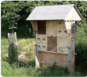
Insektenhotels sind Lernraum für Kinder und Lebensraum für Insekten