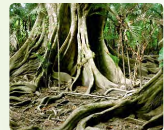
Schutz für die Ökosysteme der Welt!