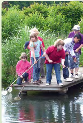
In der Natur von ihr lernen