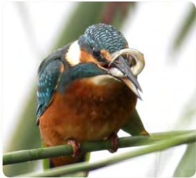
Heimischen Arten ein zu Hause in der Natur!