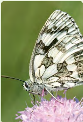
Schönheiten der Natur, Schmetterlinge