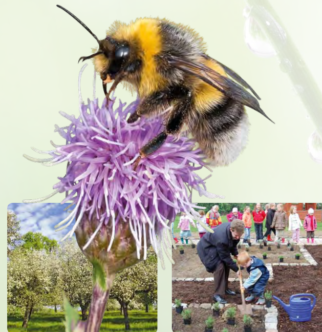
Streuobstwiesen sind eine der gefährdetesten Biototypen