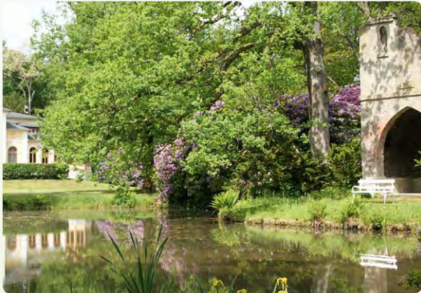
Gartendenkmal Breidings Garten für Flora, Fauna und Mensch wieder ein Erlebnis